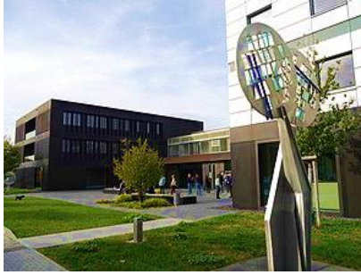
Instituto Max Planck de Derecho Público Comparado y Derecho Internacional Público