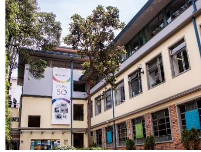
Facultad de Derecho Universidad de los Andes