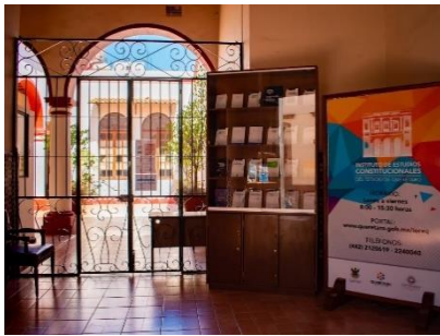
Instituto de Estudios Constitucionales del Estado de Querétaro